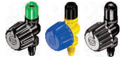
Idra™ Mini Vortex