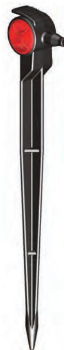
Delta™ Drip Spike PC 2 l/h (Fin de Línea)