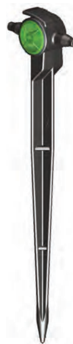
Delta™ Drip Spike PC 8 l/h (En línea)