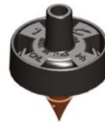
Mikra™ 1 l/h Cannelé 4,5 mm