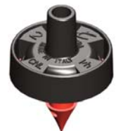
Mikra™ 2 l/h Cannelé 4,5 mm