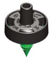
Mikra™ 8 l/h Cannelé 4,5 mm