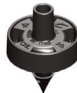
Mikra™ 4 l/h Cannelé 4,5 mm