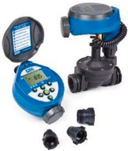
Centraline a batteria serie 400A