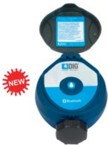
Centralina a batteria Bluetooth® serie 410BT