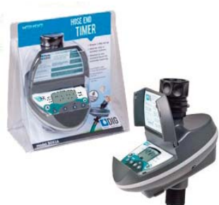
B09D Centralina Digitale