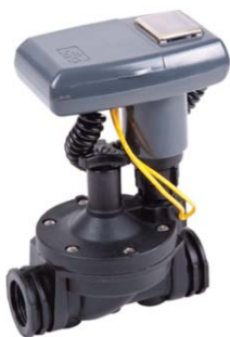
Valvola in linea LEIT 1™