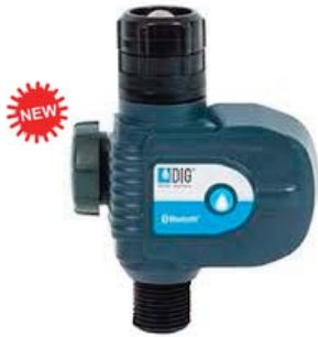
Centralina Bluetooth® BOHE-BT I