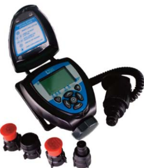
Centralina di Propagazione serie 710AP-000