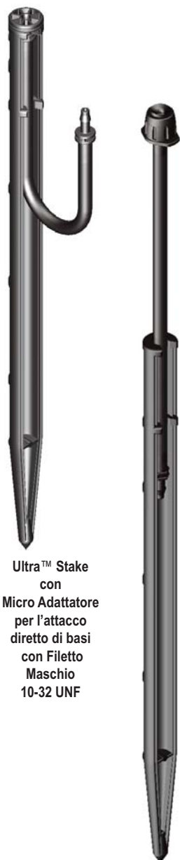
Ultra™ Stake con Micro Adattatore per l'attacco diretto di basi con Filetto Maschio 10-32 UNF