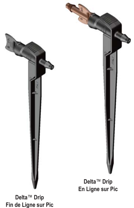
Delta™ Drip Fin de Ligne sur Pic