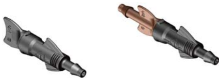
Delta™ Drip Fin de Ligne Cannelé 4,5 mm